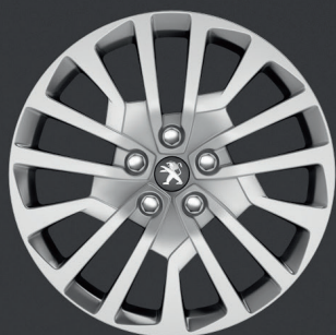
Okrasný kryt Miami 17"