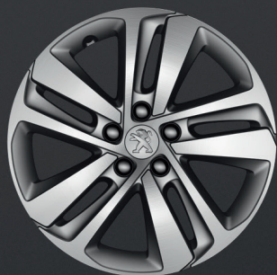
Hliníkový disk Phoenix 17"