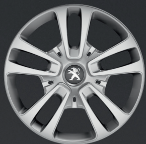
Okrasný kryt San Francisco 16"