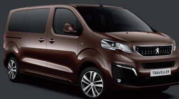
Hnědá Rich Oak